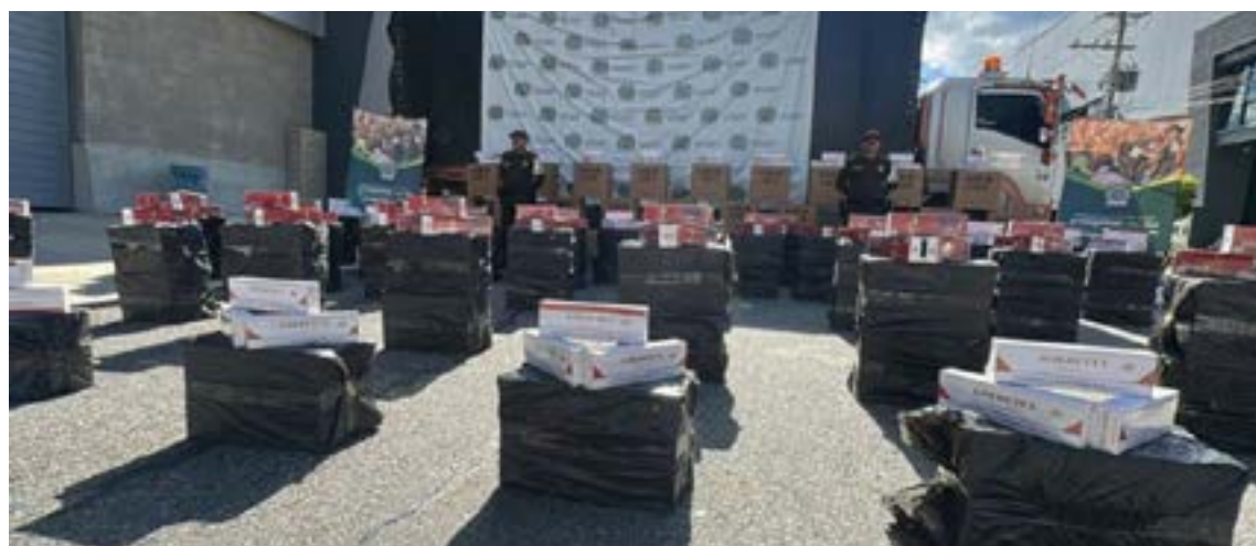
Cargamentos de contrabando

Al respecto precisó: «Sale la cocaína por Buenaventura y entran los contenedores de ropa china y coreana que se compraron con los mismos dineros de la cocaína, y entran por el puerto de Buenaventura, y pasan libres por la carretera hasta llegar a Bogotá, a Medellín, a Ibagué».