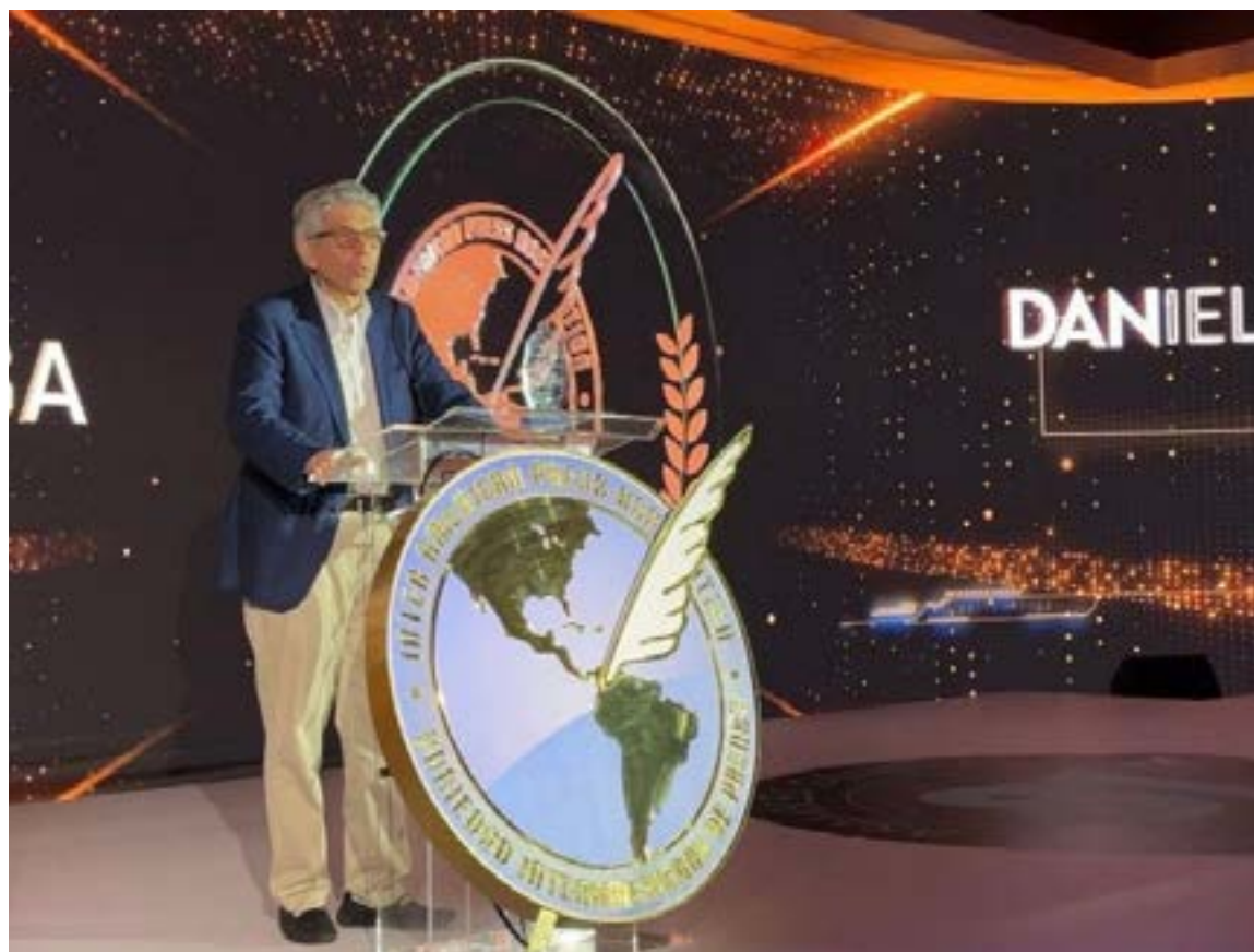
«Hemos visto caer asesinados a 169 periodistas en Colombia»: Daniel Coronell

El periodista, que ha desarrollado la mayor parte de su carrera en Colombia, hizo un crudo balance de la situación en su país, donde «ser periodista y estar amenazado han sido casi sinónimos». Recordó el doloroso episodio de 2005, cuando su familia fue víctima de una campaña de amenazas que incluyó a su hija. Subrayó, además, que «hemos visto caer asesinados a 169 periodistas en Colombia», citando cifras de la Fundación para la Libertad de Prensa.