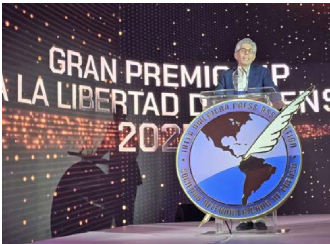
Daniel Coronell, ganador del Gran Premio a la Libertad de Prensa 2025 de la Sociedad Interamericana de Prensa (SIP)

Coronell dedicó «de manera ferviente» el galardón a «una bala, a la bala de la que escapé y que se quedó esperándome gracias a una persona que hoy está entre nosotros», aludiendo a un atentado fallido en Colombia.