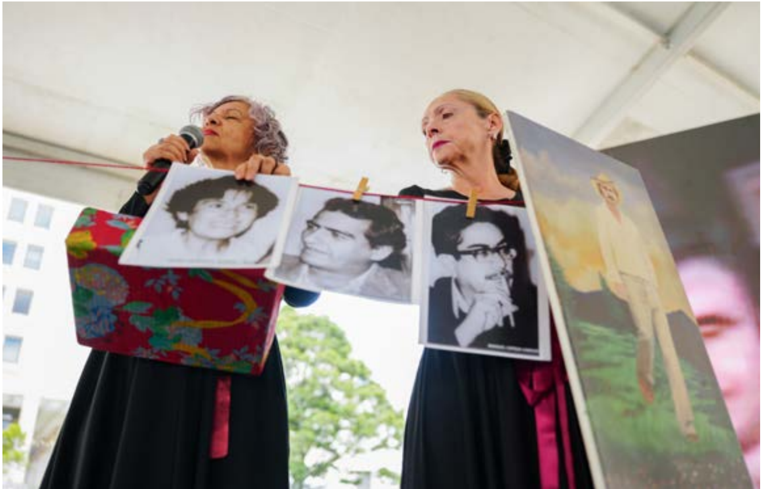
Ante las víctimas y familiares que compartieron sus testimonios, el Jefe de Estado fue más allá y exigió a la sociedad colombiana aceptar la existencia de un genocidio sistemático.

El evento se realizó para acatar el fallo de la Corte IDH, que determinó la responsabilidad internacional de Colombia por la persecución estatal contra los defensores de derechos humanos de CAJAR, que incluyó graves acciones como inteligencia ilegal, estigmatización y amenazas.