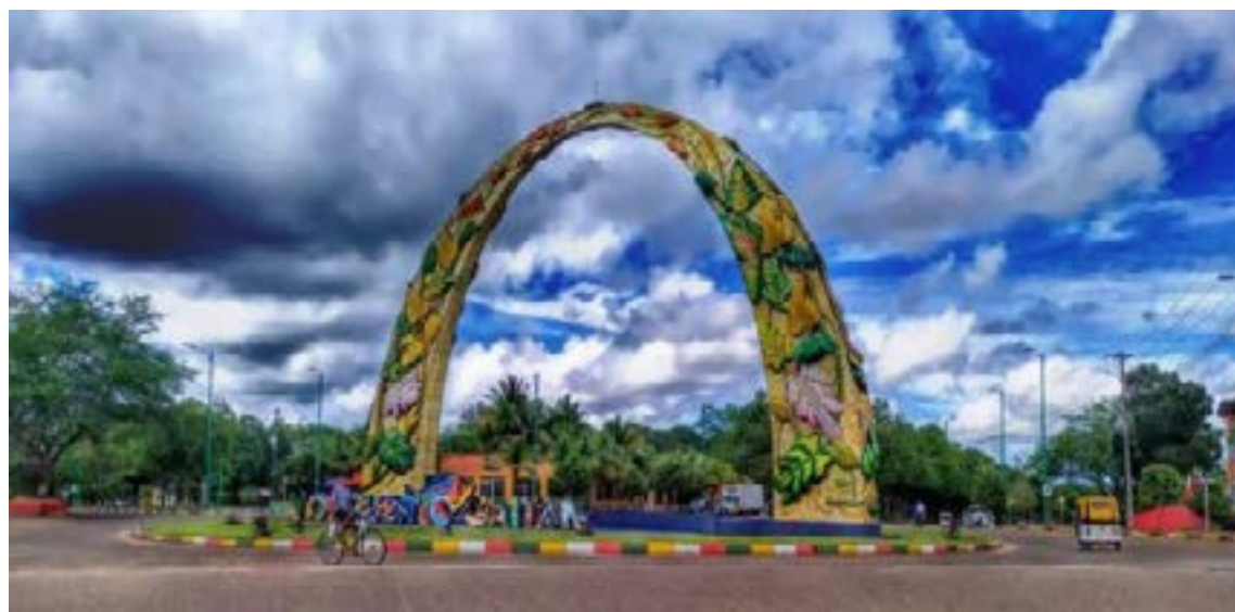
Puerto Gaitán y su símbolo el Arco

La travesía por el río Cravo lleva al Hotel finca San Pablo. Bonito sitio alejado del bullicio de las grandes ciudades. Es un alojamiento con buenos servicios y gente amable; con vegetación nativa en todos sus costados y ruido de animales asombrosos como chigüiros, osos meleros, zorros y osos palmeros. El hotel ofrece comidas, playas, recorri-