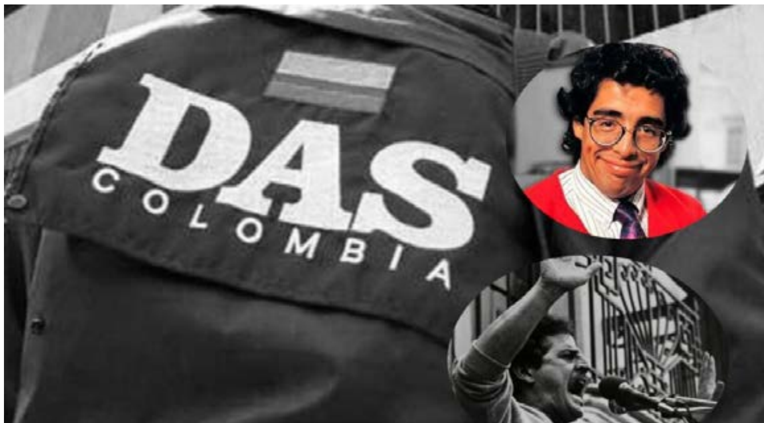
Agentes del DAS participaron de manera directa e indirecta en el asesinato de Jaime Garzón y Luis Carlos Galán. Los crímenes se incrementaron cuando el gobierno le entregó el control de ese organismo al paramilitarismo.

El decreto abarca la desclasificación total de los archivos relacionados con: